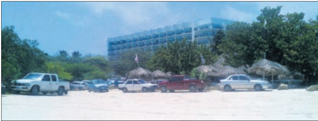
E bista di Marriott for di beach

ORANJESTAD —Construccion di Hotel Ritz Carlton ta creando desorden completo den e area di beach, y turistanan y negoshinan acuatico ta sufriendo e consecuencianan. Trahadonan di e contratista encarga cu construccion di Ritz Carlton a pasa nan tempo ta purba piki e 'foamnan' chikito cu a keda acumula riba beach dilanti e hotel den construccion despues cu potretnan riba Facebook a yega te na